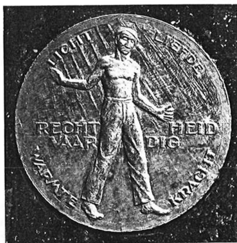
D. Wolbers, Ontwerp Jubileumpenning Staatsmijnen, 1952.

Het ontwerp dat Dirk Wolbers maakte was eveneens sterk symbolisch van aard. In zijn toelichting zegt hij dat 'het geheel wordt beheerst door de arbeidersfiguur waarmee ik het bedrijf wil symboliseren. De rechterhand is opgeheven en wijst, of nog beter, ontvangt het licht dat van boven komt. De linkerhand grijpt naar beneden naar het materiaal dat uit de aarde wordt gedolven en dat gesymboliseerd wordt door 'warmte' en 'kracht'. Verder merkt hij op voor de figuur 'een oudere arbeider' te hebben gebruikt: als geen ander drukt deze 'de aanpak' uit.