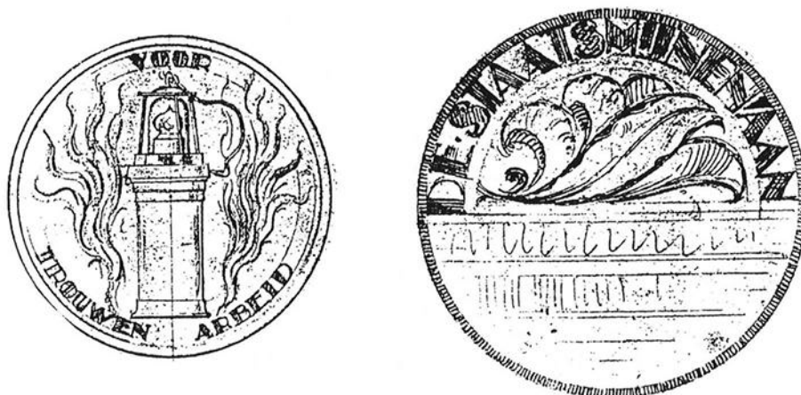
C.J. van der Hoef, Definitief ontwerp draagmedaille 1927.

Van enige kritiek op deze ontwerpen is niets bewaard gebleven maar die zal zeker zijn geuit, de mijnlampen die hij had geschetst leken namelijk op geen enkele wijze op de lampen die in 1927 werden gebruikt. Uiteindelijk is toch een modernere lampenversie op de penning gekomen.