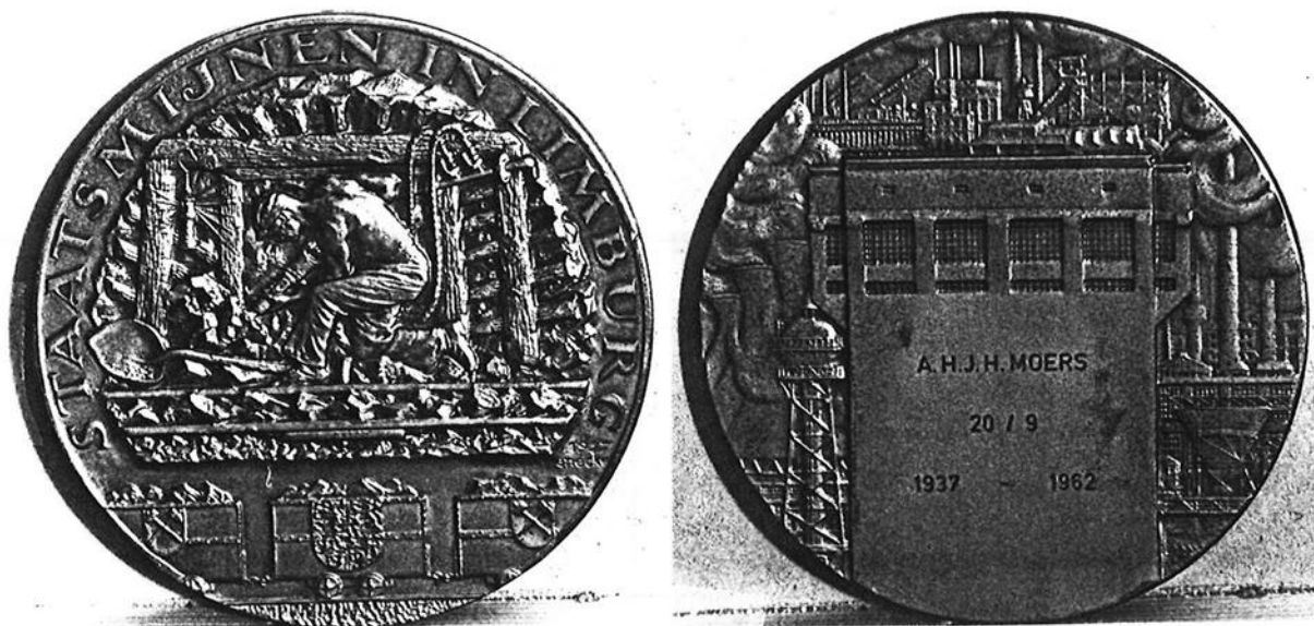
J.C. Wienecke, bronzen penning 'De Staatsmijnen in Limburg', 1927.

Wienecke zei ja voor het ontwerpen van de 'Eerepenning' in brons. Deze moest volgens hem 'geheel in overeenstemming met de belangrijkheid van de Staatsmijnen' worden 4) . Om dat te kunnen verwezenlijken ondernam hij de tocht naar het zuiden en daalde af in de mijn 'Emma'. Daar verbleef hij drie uren. Voorts liet hij zich enkele specifiek bij de mijnarbeid gebruikte gereedschappen 5) thuis sturen, alsmede een tekening van een mijnwagen. Uit dat alles haalde hij voldoende inspiratie om snel te komen tot het uiteindelijke resultaat. Van zijn voorbereidende werkzaamheden, met name in de vorm van schetsen, is weinig in de archieven bewaard gebleven.