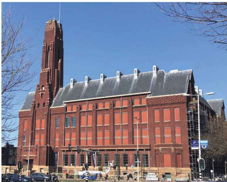
Het gebouw Petrolea is tegenwoordig eigendom van Spaces en wordt ook wel 'Rode Olijfant' genoemd, april 2021

neorenaissance stijl door de architecten M.A. en J. van Nieuwkerken gebouwd en in 1928-1930 uitgebreid. De American Petroleum Company wilde een moderner gebouw dat ook een goede representatieve entree kon bieden voor de belangenbehartiging van haar oliebelangen bij de regering in Den Haag, Nederlands-Indië en Aruba. Het in februari 1924 geopende gebouw werd gebouwd volgens de regels van de Amsterdamse school en werd in rode baksteen uitgevoerd. Het forse kantoorpand staat op een granieten sokkel. Het interieur in Art Deco stijl wordt gekenmerkt door