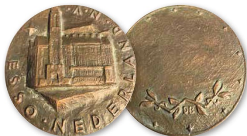
Voorzijde van penning ontworpen door Dirk Bus, met het gebouw Petrolea, 1958