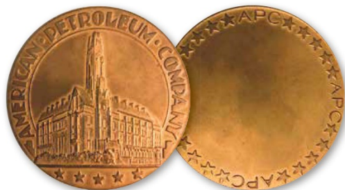
Voorzijde penning American Petroleum Company, 1928

worden dan het op niet zo verre afstand gelegen gebouw van de grote concurrent, de Bataafsche Petroleum Maatschappij/Koninklijke Nederlandse Petroleum Maatschappij (Shell) aan de Van Bylandtlaan. Dit laatste gebouw werd in 1915-1917 in