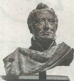
Koning Willem I Christian Daniel Rauch, 1842. Brons, 51,5 x 48,5 cm. Afgietsel van een marmeren beeld uit Brussel.

REPORTAGE BEELDENGALERIJ VAN DRIE VORSTINNEN, VIER VORSTEN EN EEN VADER DES VADERLANDS