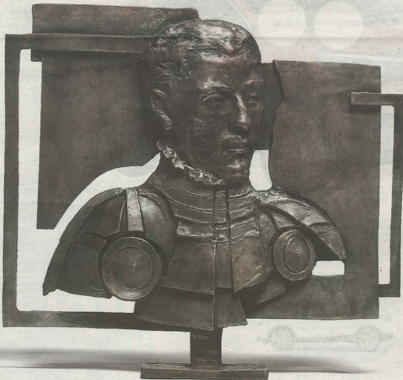
Willem van Oranje Eric Claus, 2015. Brons, 55 x 59 cm.