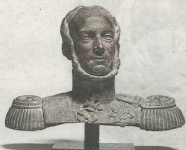
Koning Willem II Jozef Geefs, 1843. Brons, 49 x 59 cm. Afgietsel van een marmeren beeld uit het Koninklijk Huisarchief, Den Haag.