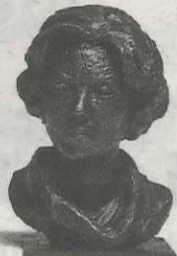
Koningin Beatrix Nel van Lith, 1983. Brons, 42 x 28 cm.