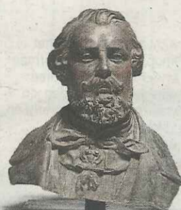
Koning Willem III Beeldhouwer onbekend, omstreeks 1860. Brons, 49,5 x 37 cm. Afgietsel van een gipsen beeld uit Museum Rotterdam.