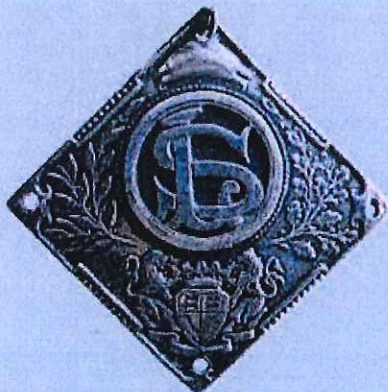
Enkelzijdige bestuurspenning, brons, geslagen, 50x50 mm (aan fluwelen draaglint)

De eerste penning is een vierkante penning aan een groen, goudgebieds fluwelen draaglint met breedte 36 mm. Deze geslagen penning is enkelzijdig en heeft op alle hoeken een gaatje. Waarschijnlijk waren de gaatjes bedoeld voor bevestiging op een achtergrond, mogelijk een presse papier, voorzittershamer of houten sierdozen; we weten het niet. De voorzijde toont een kloeke cirkel met het monogram SL – Sanctus Laurentius. Onder de cirkel een fictief gekroond wapenschild dat veel weg heeft van het Rotterdamse wapen, gehouden door twee leeuwen. Het veld wordt elegant opgevuld met links en rechts respectievelijk een lauriertak en een eikentak.