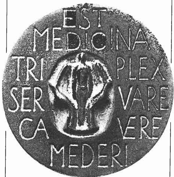
Medisch dispuut. Cat. 11.

Bij de vergrotingen werd door hem bij uitzondering, zoals in het portret van Willem van Oranje, de figuratie geboetseerd. Het negatief afgietsel in gips, alsook het latere positief afgietsel hiervan, sneed hij dan weer bij. De letters bleef hij echter altijd regelrecht in het negatief snijden. Hiervoor gebruikte hij schrappertjes die hij van een tandarts had gekregen.