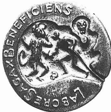
Verzekeringspenning. Cat. 12.

universiteit in breedschrift (tot een vast stuensel ende onderhoudt der vrijhey ende goede wettelicke regeringe des lants). Gegoten bij Begeer. vW 2184.