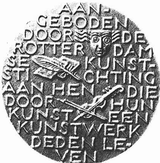
Geschenkenpenning voor herscheppende kunstenaars. Cat. 2.