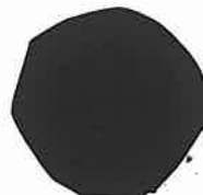
Laurensdukaat. Cat. 8.