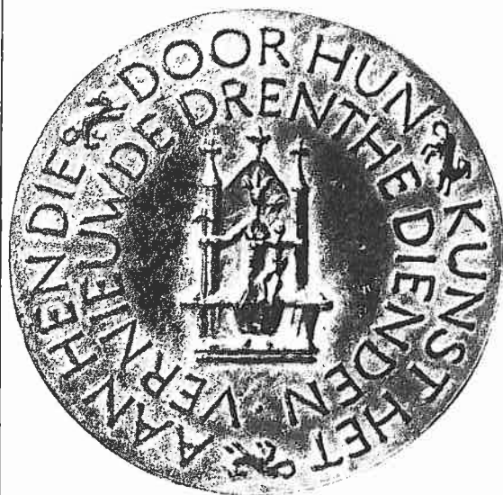
Kultuurprijs Drente. Cat. 5.

kant naar elkaar verwijzen en moeten zij elkaar aanvullen. Daarbij acht hij de voorkant beeldend en plastisch het belangrijkste.