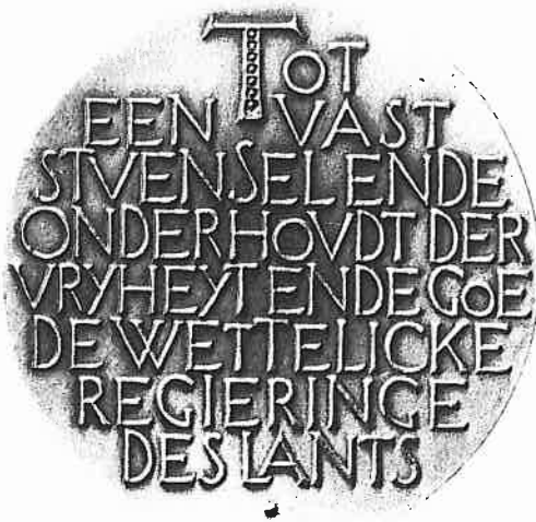
T.b.v. het Leidse universiteitsfonds. Cat. 3.

cliënt loopt en dat dankzij de assuradeur wordt vernietigd. Een uiltje (de wijsheid) kijkt welwillend toe.