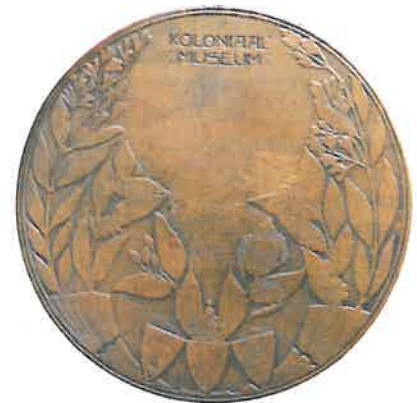
Bronzen beloningspenning van het Koloniaal Museum door J.B. Kamp vervaardigd bij Begeer te Utrecht

In 1906 was hij jurylid in een beoordelingscommissie van het Koloniaal Museum in Amsterdam en ontving, als dank, een bronzen penning.