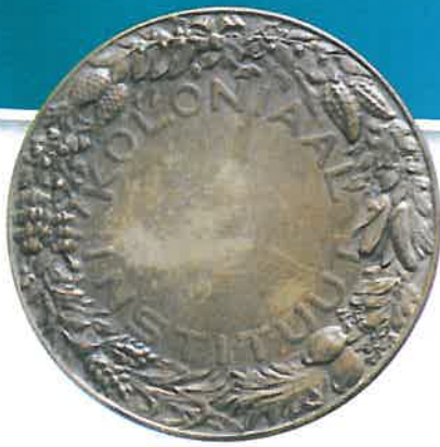
Bronzen beloningspenning van het Koloniaal Instituut door Louis J. Vreugde 1914