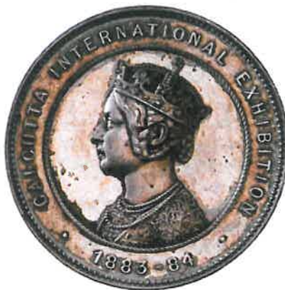
Zilveren prijspenning van de Calcutta International Exhibition 1883-84

Tijdens de "Calcutta International Exhibition" in 1883-1884 ontving hij een persoonlijke, op eigen naam gestelde, bronzen penning.