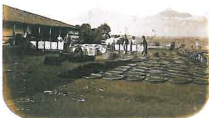
Werksaamheden op een theeplantage ca. 1880