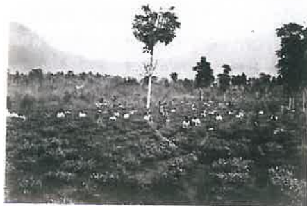
Theepluk op Parakan-Salak ca. 1880

In de spijfunctie als directiesecretaris, commies-notularis, werd hem najaar 1862 gevraagd om een standpuntbepaling inzake een verzoekschrift van het bedrijfsleven tot instelling van een eigen muntinrichting in Indië. Dit om de muntcirculatie beter op peil te kunnen houden.