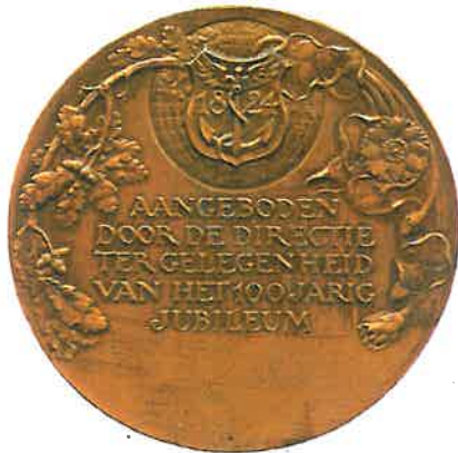
Penning van de Nederlandsche Handel Maatschappij uit 1924 door J.C. Wienecke, uitgegeven ter gelegenheid van het 100-jarig bestaan

In 1855 werd hij uitgezonden naar Nederlandsch-Indië, met als standplaats Batavia. Vrij snel werd hij assistent van de president van de N.H.M.-factorij te Batavia, de heer W. Poolman, gevolgd door een benoeming tot directiesecretaris.